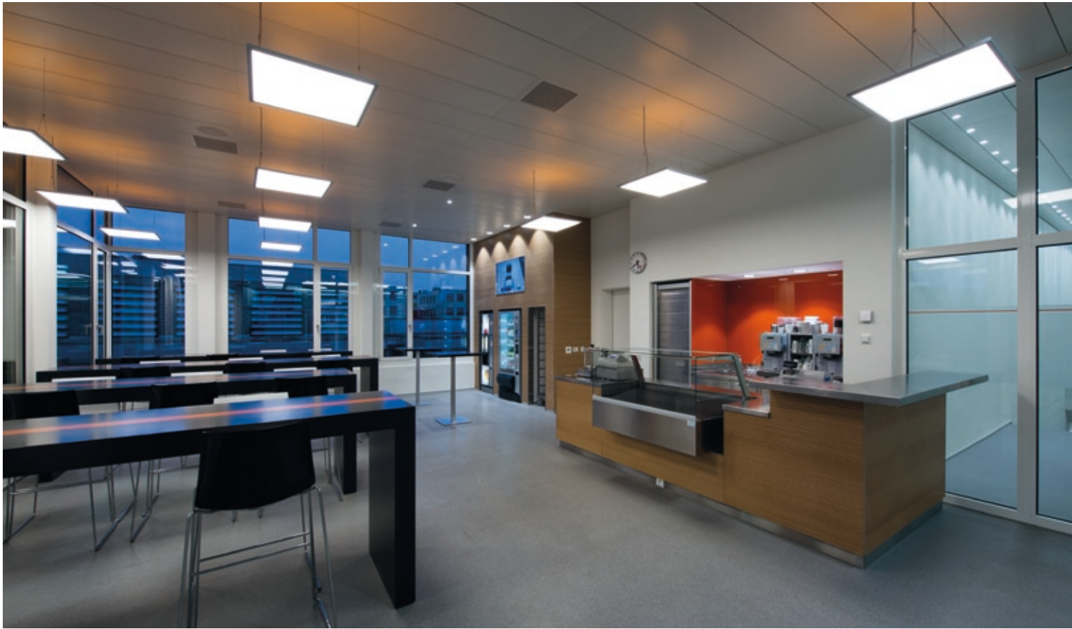
Sidelite® Quad | Heledon®

Das Kurszentrum des Baumeisterverbands ist eine auf praktisches Lehren und Lernen ausgelegte Bildungsstätte für diverse Berufe der Baubranche. Mit einer optimalen Mischung aus hochwertigen, technisch dekorativen Serien-Leuchten und Beleuchtungskörpern nach Maß realisierte die Giger Licht AG aus Zürich ein Schulungszentrum, dessen Beleuchtung eher an ein Tagungszentrum erinnert, als an eine Ausbildungsstätte.