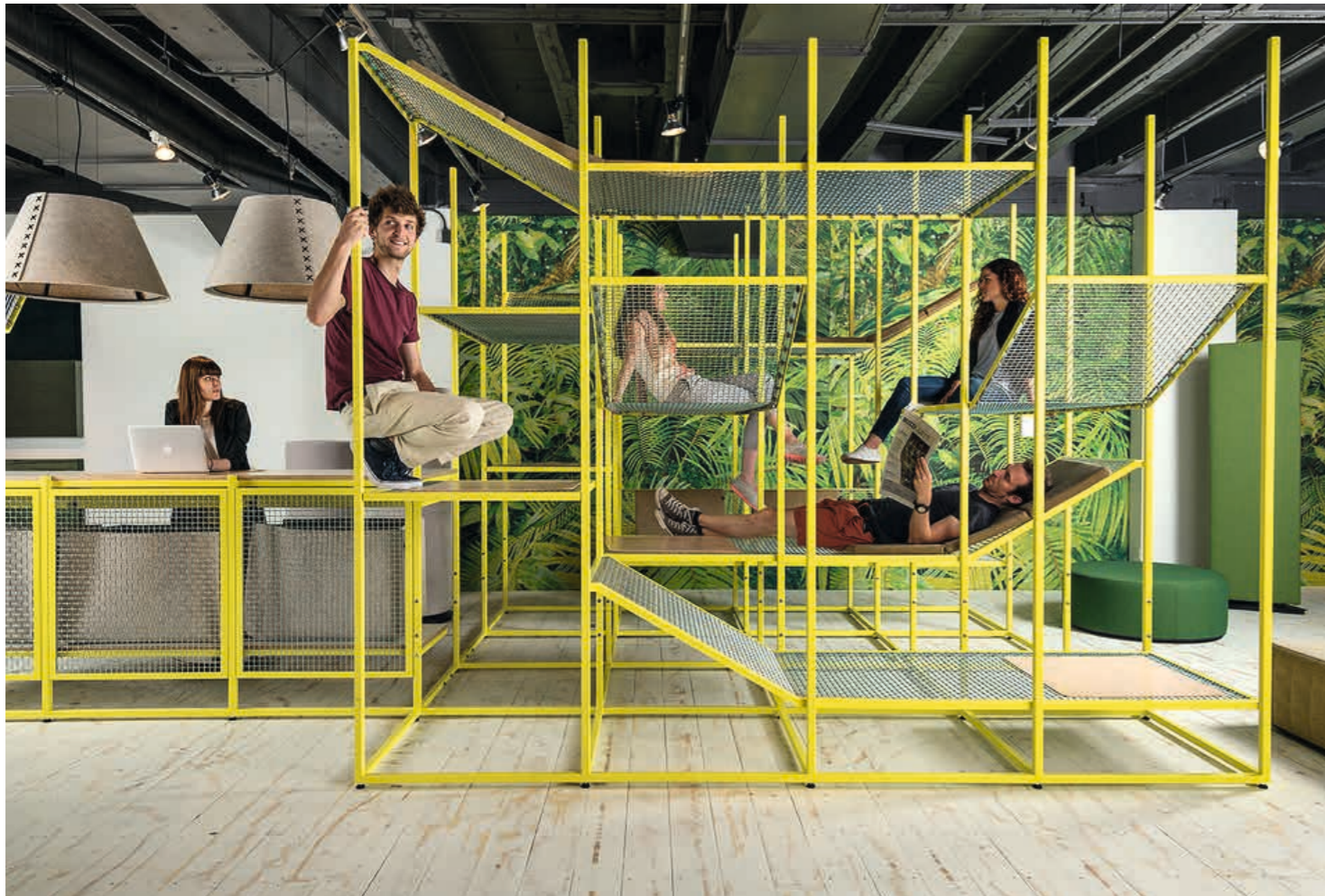
Die Variante mit integrierter Lobby – als Empfangstresen oder als Arbeitsplatz für den Protokollschreiber.